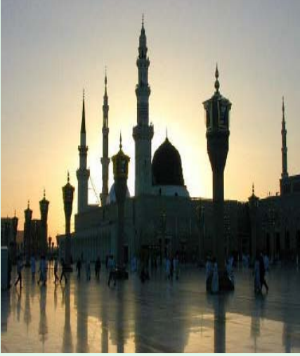
Masjid Nabawi, Madinah

لَنْ تَنَالُوا الْبِرَّ حَتَّى تُنْفِقُوا مِمَّا تُحِبُّونَ