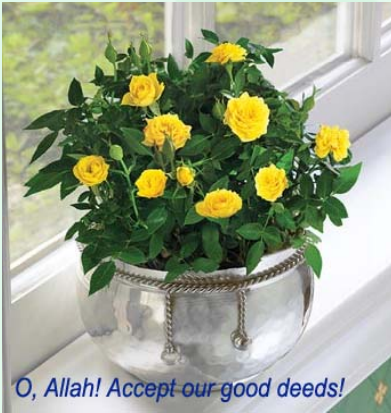
O, Allah! Accept our good deeds!

نساء الرسول صلى الله عليه وسلم أوقفوا الكثير من أموالهن الكثير من الأموال الموقوفة كانت تحسب للنساء، لا سيما أخوات وزوجات وبنات الخلفاء والسلاطين، والنساء المقدرات مالياً، فاطمة الفهرية أوقفت جامع القيروين 425هـ وهو الآن جامعة